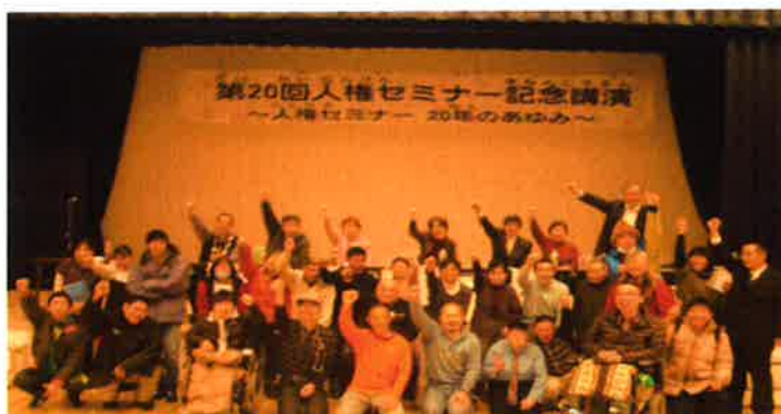
じんけん せ みな ー しゅうねんきねんこうえん さんかしゃしゅうごうしゃしん 人権セミナー20周年記念講演の参加者集合写真

いっしょ こうりゆう まな ひと さんか ま ように、一緒に交流して、学びましょう!! たくさんの人の参加をお待ちしております!!